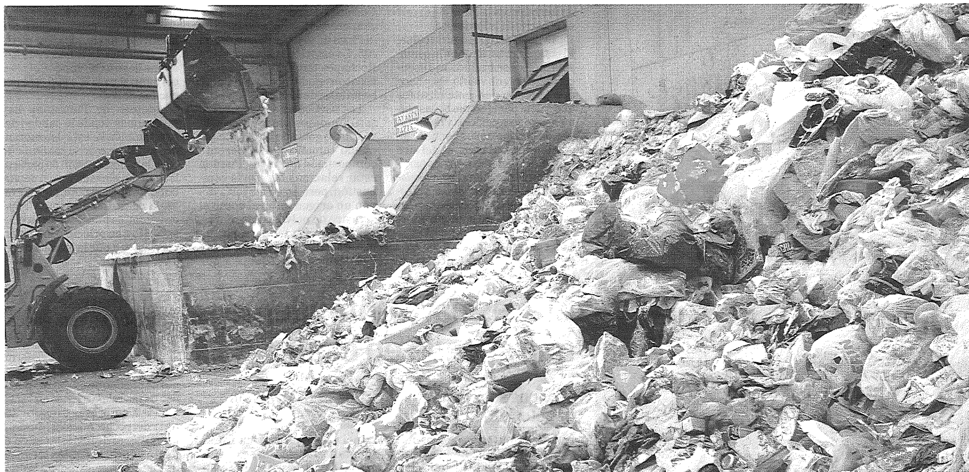
Una pala trabaja con la basura en el centro de tratamiento de residuos de Góngora.

El Ejecutivo navarro nunca ha llegado a hacer pública una ubicación para la incineradora, si bien el PIGRN dibuja una zona prioritaria que incluye la comarca pamplonesa, Valdizarbe y la Zona Media. Movimientos ecologistas y ayuntamientos como el de Tafalla mostraron su oposición a la instalación. Respecto a los partidos políticos, todos menos IU asumieron en febrero de 2011 las claves del plan, pero ya en la campaña electoral de mayo UPN se quedó sólo como defensor sin matices de la incineración.