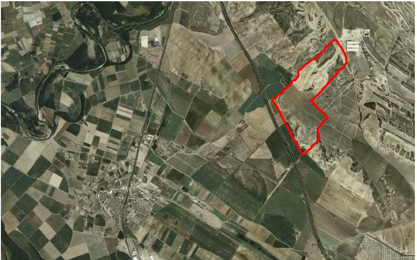
Figura 1. Localización de la zona de préstamo – vertedero en Villafranca.

La falta de previsión y las desviaciones técnicas y de recursos se hacen más patentes, cuanto más grande es el proyecto a realizar. La búsqueda propagandística de proyectos cada vez de mayor tamaño, además de endeudar a las Administraciones Públicas por los créditos solicitados a bancos o peajes "en la sombra" contraídos con las empresas contratadas, ha servido para generar un mayor gasto del previsto inicialmente. Un negocio brillante llamado "Obra Pública" que en Navarra ha pretendido extenderse con mega-infraestructuras más allá de la "crisis del ladrillo" iniciada en el año 2007.