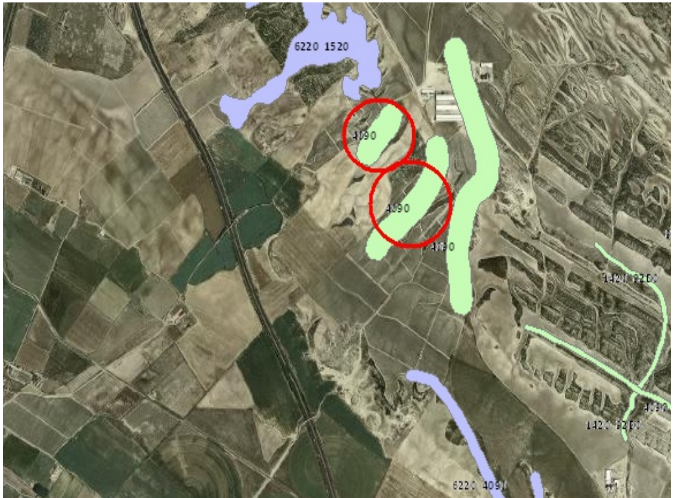
Figura 3. Destrucción de toda la superficie correspondiente al Hábitat 4090 “Brezales Oromediterráneos endémicos con aliaga”.

De igual modo se omite una grave afección a hábitats identificados en la Directiva 92/43/CE relativa a los hábitats, que de una forma u otra son interesantes de cara a su representatividad en el continente europeo y sus características endémicas o singulares. El vertedero acabaría con el Hábitat arbustivo 4090 “Brezales Oromediterráneos endémicos con aliaga” . El valor de estos hábitats en la ribera Navarra y más en concreto en el término municipal de Villafranca es mucho mayor, pues la actividad antrópica ha configurado una matriz continua de cultivos que reportan al paisaje un elemento diferente y son un hábitat interesante para multitud de especies faunísticas.