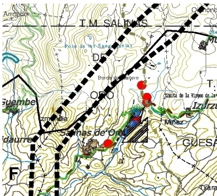
Impacto visual sobre Salinas de Oro (Tramo F)

Respecto del impacto sobre el medio socio-económico el documento analizado se despacha en un solo folio y comienza con una afirmación absolutamente gratuita “Los efectos más significativos sobre el medio socio-económico son positivos”. De este modo, no entra a valorar en ningún momento las afecciones derivadas del proyecto sobre el sector primario, que cuenta con varias denominaciones de origen en el área de influencia. Tampoco tiene en cuenta la ocupación de espacios tanto para la base de las torretas como para el elevado y la construcción de las mismas, ni siquiera las distintas servidumbres que una obra de estas características y dimensiones va a acarrear.